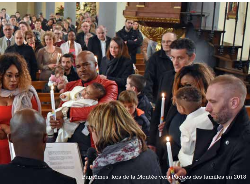
Baptêmes, lors de la Montée vers Pâques des familles en 2018

de les rejoindre à l'occasion des célébrations qu'ils animeront (voir horaires ci-dessous) mais aussi pour le film La Résurrection du Christ.