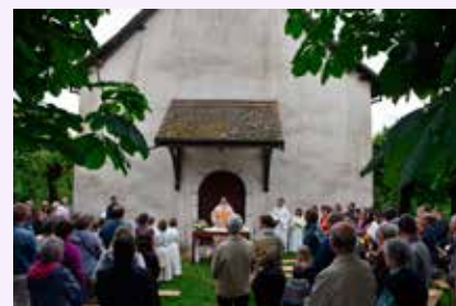
Fête-Dieu à St-Gilles en 2018