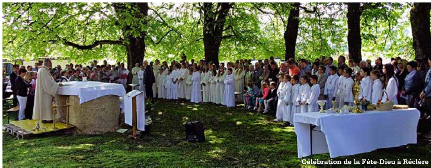
Célébration de la Fête-Dieu à Réclère

10h, Boncourt 10h, Fregiécourt 10h, Porrentruy, Hôpital 10h, Porrentruy, St-Pierre, animée par la Sainte-Cécile 10h, Réclère 10h, Soubey, patronale 18h, Porrentruy, St-Germain