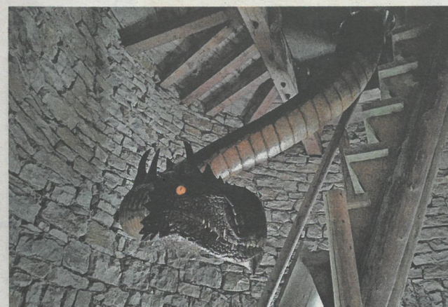
Un étonnant dragon vous attend lors de la visite.