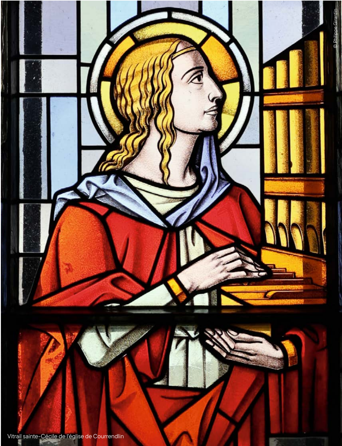
Vitrail sainte-Cécile de l'église de Courrendlin